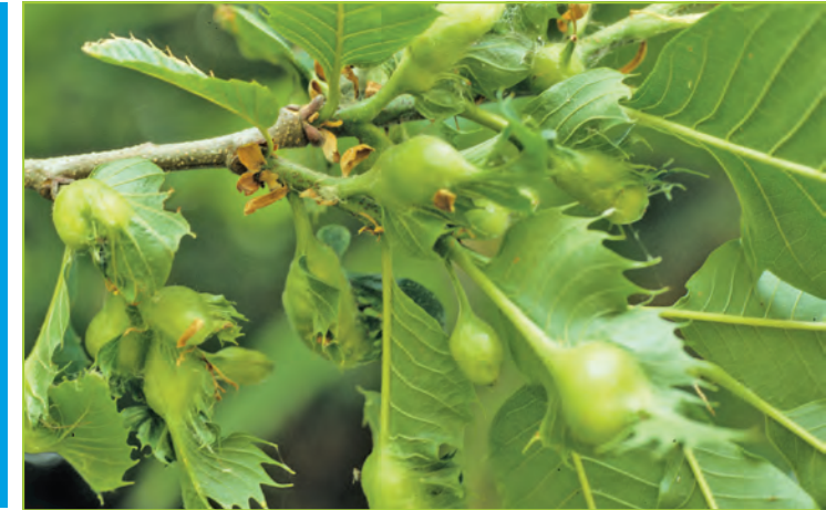
Durch die Japanische Esskastaniengallwespe hervorgerufene Blattgallen an Esskastanie ( Castanea sativa )

Die Japanische Esskastaniengallwespe ( Dryocosmus kuriphilus ) ist weltweit eines der schädlichsten Insekten an Bäumen der Gattung Castanea , die die Baumgesundheit beeinträchtigen und die Erzeugung und Qualität der Esskastanienfrüchte erheblich mindern kann. Aus ihrer ursprünglichen Heimat in Südchina ist die Gallwespe in verschiedene Länder verschleppt worden und wurde im Jahr 2002 in Italien erstmals in der Europäischen Union nachgewiesen. Inzwischen kommt sie in mehreren EU Mitgliedstaaten vor und wurde im Jahr 2013 erstmals für Deutschland in Baden-Württemberg und Nordrhein-Westfalen nachgewiesen.