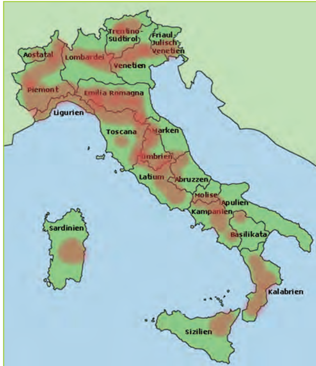
Auftreten der Esskastaniengallwespe in Italien im gesamten Vorkommen der Esskastanie (Stand 2012).

Im Jahr 2002 trat D. kuriphilus erstmals in der EU in Norditalien (Piemont) südlich der Stadt Cuneo auf. Inzwischen wurden befallene Pflanzen in allen Regionen Italiens (einschließlich Sizilien und Sardinien) mit Esskastanienvorkommen festgestellt. Die Vitalität und Fruchtproduktion der Kastanie ist dadurch z. T. stark beeinträchtigt.