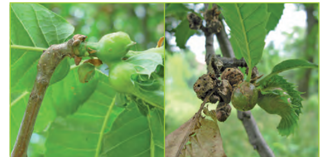
Durch Vorjahresbefall bedingte Triebkrümmung (links), alte Galle aus Vorjahr und diesjährige Galle (rechts)