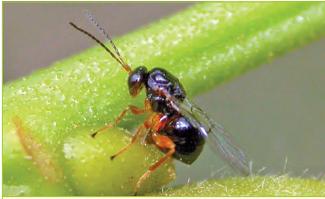
Weibchen der Esskastaniengallwespe bei Eiablage

Gallwespen sind kleine Insekten, die andere Insekten oder Pflanzen parasitieren. Als Pflanzenparasiten legen sie ihre Eier an oder in Pflanzenteile ab, die auf den Reiz der sich darin entwickelnden Eier und Larven mit Wucherungen reagieren und eine Galle erzeugen. Diese besteht im Inneren aus einer Nährschicht, von der sich die Larve ernährt. Die Innengalle ist zum Schutz von einer harten Außenschicht umgeben.