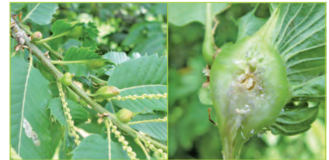
Knospengallen (links) und aufgeschnittene Galle (rechts) mit Larven und Puppen im Juli