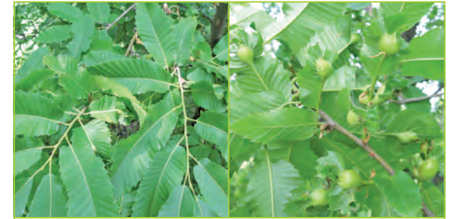
Blattgallen: Ansicht befallener Blätter von oben (links) und von unten (rechts)

Eine aktive Bekämpfung der Esskastaniengallwespe ist sehr schwierig. Die Insekten sind in den Gallen gut geschützt, so dass Insektizide nicht den gewünschten Erfolg zeigen. Zudem wäre im Jahresverlauf eine mehrfache Spritzung nötig, was aus Gründen der Wirtschaftlichkeit, des hohen Aufwandes und der ökologischen Bedenken als nicht realistisch angesehen wird. In italienischen Baumschulen laufen Versuche zur Pflanzenanzucht in engmaschigen Netztunneln. Am aussichtsreichsten erscheint der Einsatz von Parasitoiden. So konnten in Japan mit Hilfe der Gallwespe Torymus sinensis gute Bekämpfungserfolge gegen D. kuriphilus erzielt werden. Diese Form der biologischen Bekämpfung wird auch in Italien praktiziert.